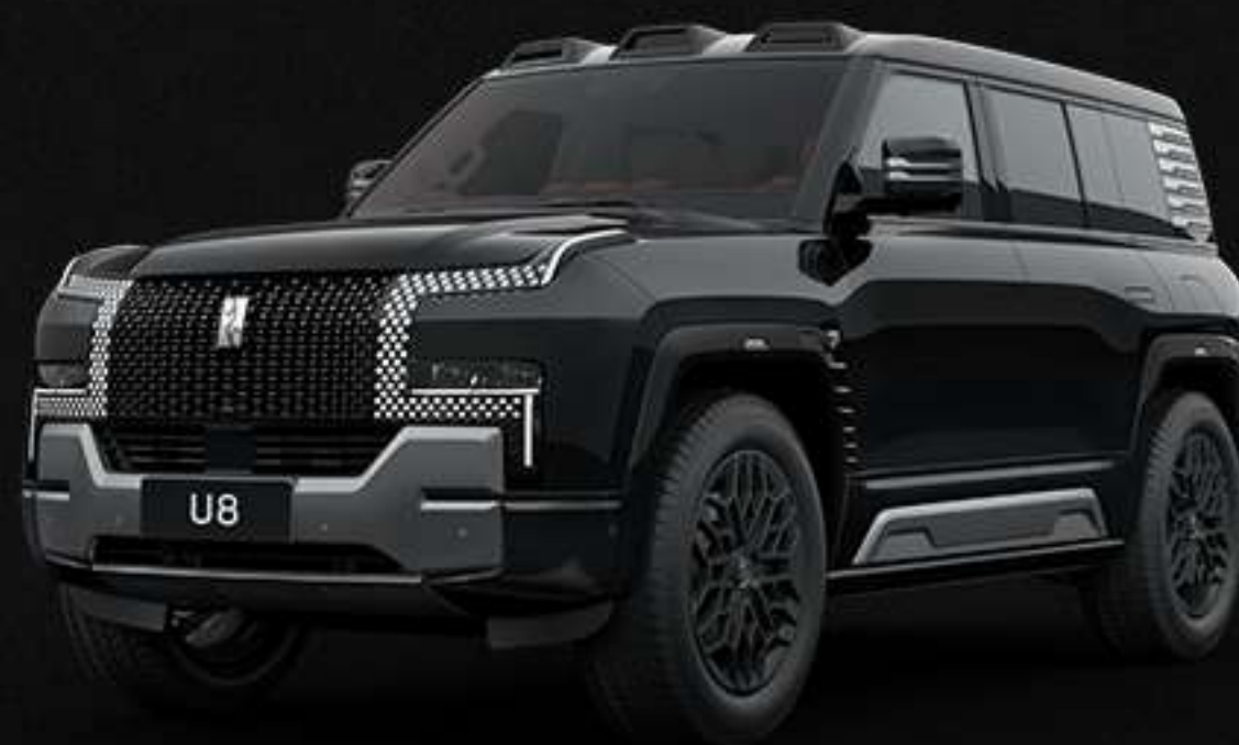
OBSIDIAN BLACK ოპსიდონის ანაზი