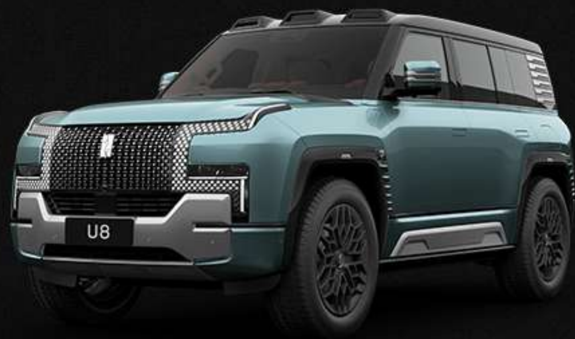
DRAGON STONE GREEN ღრუკონის ანვანა