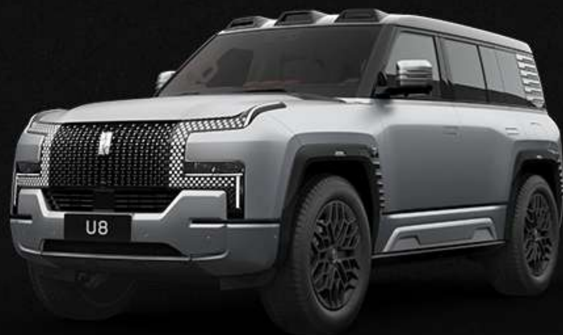
MATTE MOONLIGHT SILVER | 7000$ აქრანი (ანტი) ათვარის ვერცხლისფერი