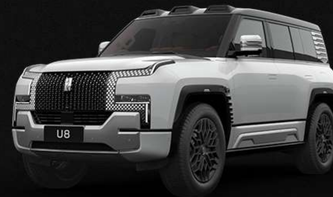
FLUORITE WHITE ფაიონა თეთრი