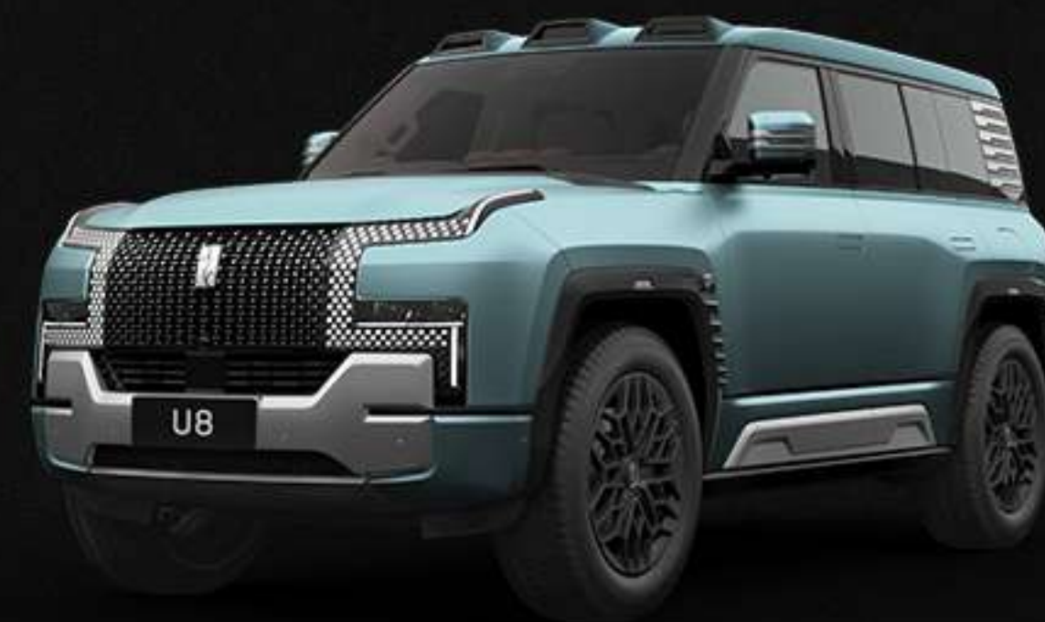
MATTE DRAGON STONE GREEN | 7000$ აქრანი (ანტი) ღრუკონის ანვანა